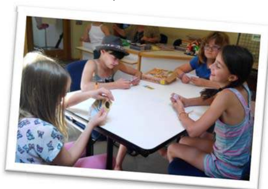
JEUX des 7 FAMILLES

Les adultes ont eu de belles rencontres également. L'après-midi autour des orchidées n'a pas rencontré le succès escompté, mais les personnes présentes étaient ravies et sont reparties avec les réponses à leurs nombreuses questions !