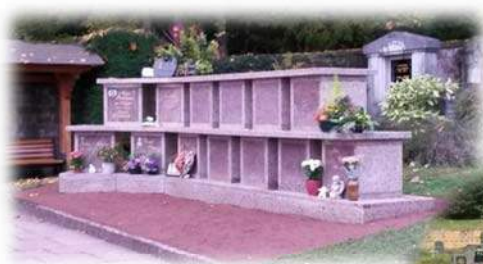
Extension du columbarium

Citons aussi l'extension du columbarium, la rénovation du monument aux morts, la réfection du terrain de pétanque.