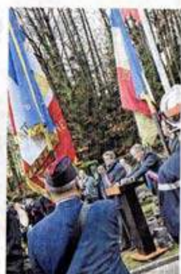
Élus, porte-drapeaux et batterie-fanfare au rendez-vous de la commémoration.