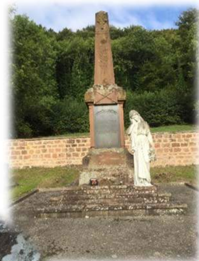
Rénovation du monument aux morts