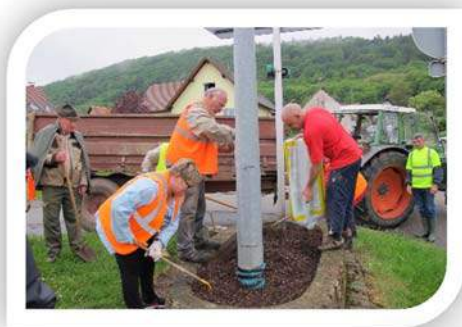
Préparation des Massifs

C'est au mois de mai, après une bonne préparation de la terre, que les membres de la commission accompagnés de bénévoles et de l'employé communal, ont procédé à la plantation.